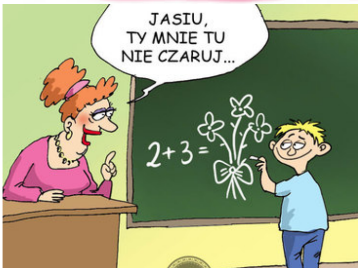
Rys. Katarzyna Zalepa

Jasiu przychodzi do domu i mówi do mamy: