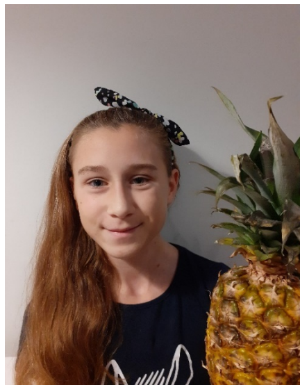
Iga - redaktor