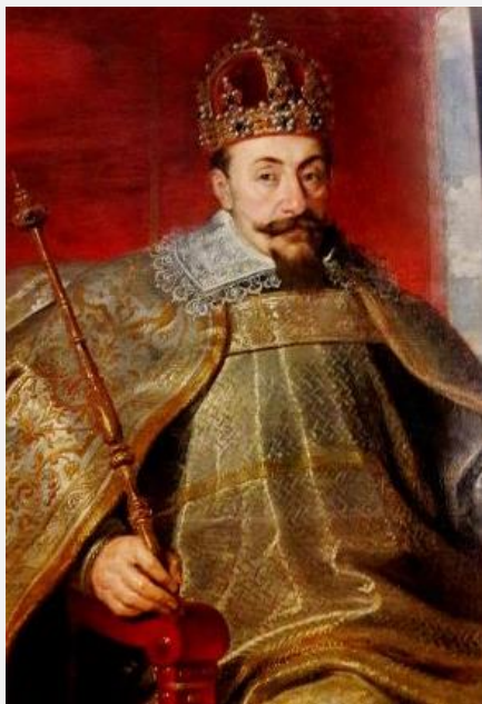
Zygmunt III Waza

Podczas elekcji roku 1573, Jan Zamoyski sprzeciwiał się powierzeniu polskiego tronu przedstawicielowi domu habsburskiego, popierając kandydaturę Henryka III Walezego. Podczas elekcji roku 1575, Jan Zamoyski zajął analogiczne stanowisko, tym razem opowiadając się za możliwością powierzenia polskiej korony Stefanowi Batoremu.