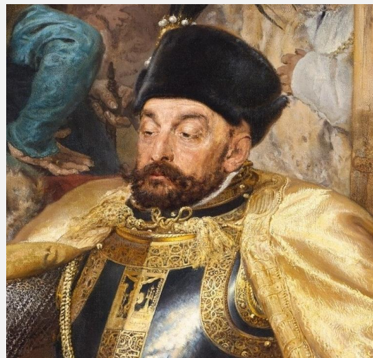
Henryk III Walezki

Pomimo pomocy okazanej królowi Zygmunтови III Wazie w sięgnięciu po polską koronę, w bardzo krótkim czasie kanclerz stanął wśród zagorzałych przeciwników monarszej polityki. Niechęć Zamoyskiego wzbudzały zwłaszcza plany Zygmunta III, wzmocnienia władzy królewskiej w oparciu, oraz we współpracy, z domem habsburskim.