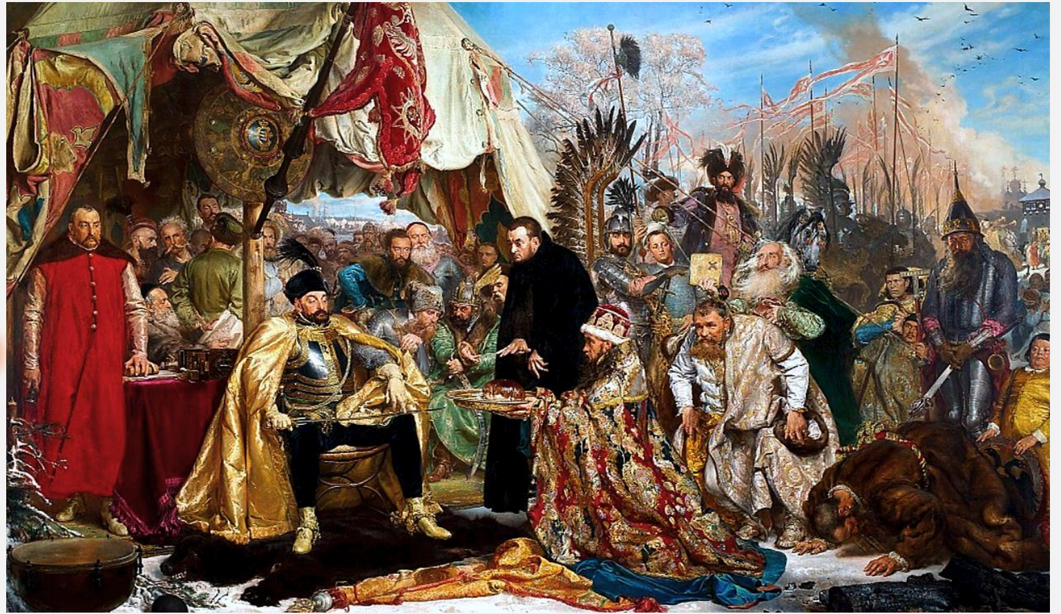
Jan Matejko „Stefan Batory pod Pskowem”, olej na płótnie, 1872 r.