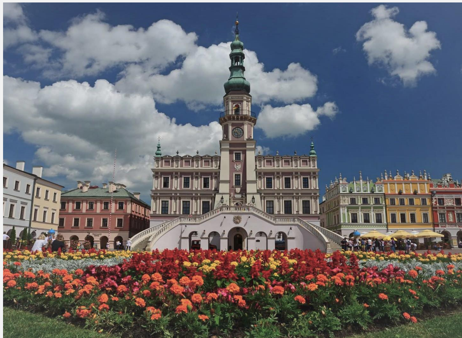
Zamość, Stare Miasto