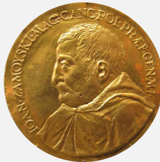
Złoty medal z wizerunkiem Zamoyskiego

Uznanie królów, pozycja męża stanu oraz doświadczonego wojskowego to nie jedyne splendory, jakich doświadczył Zamoyski. W Rzeczypospolitej II połowy XVI stulecia uchodził on za człowieka niezwykle majątnego. Jak się szacuje, kanclerz miał być posiadaczem 11 miast, 200 wsi, oraz dzierżawcą 112 królewskich miast oraz 612 wsi. Ze swego bogactwa uczynił jednak Zamoyski wielki użytek, między innymi zakładając w roku 1580 miasto Zamość, oraz fundując w roku 1595 Akademię Zamojską.